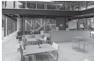
〈NINJA セッションエリア〉

ランゲージセンターは、4号館1階にて外国語自律学習支援室 NINJA(以下「NINJA」)を運営しています。