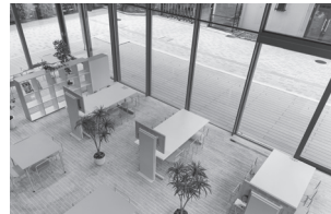
〈NINJA グループワークエリア〉