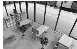
〈NINJA グループワークエリア〉