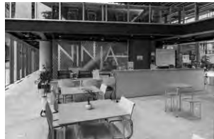
〈NINJA セッションエリア〉

ランゲージセンターは、4号館1階にて外国語自律学習支援室 NINJA(以下「NINJA」)を運営しています。