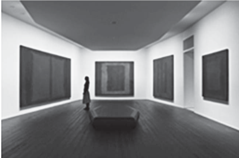
Fig.5 Mark Rothko, Seagram Murals. Kawamura Museum em Chiba