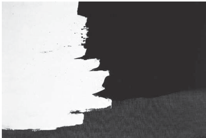
Fig.3 Waichi Tsutaka. Black and white Medium 97.2 x 145.4 cm, 1961

Um artista que me fez pensar muito foi o americano Rothko e outro, com quem conversei muito, era um excelente pintor, Waichi Tsutaka, verdadeiro filósofo, infelizmente morreu no terremoto em Kobe, onde morava em 1995.