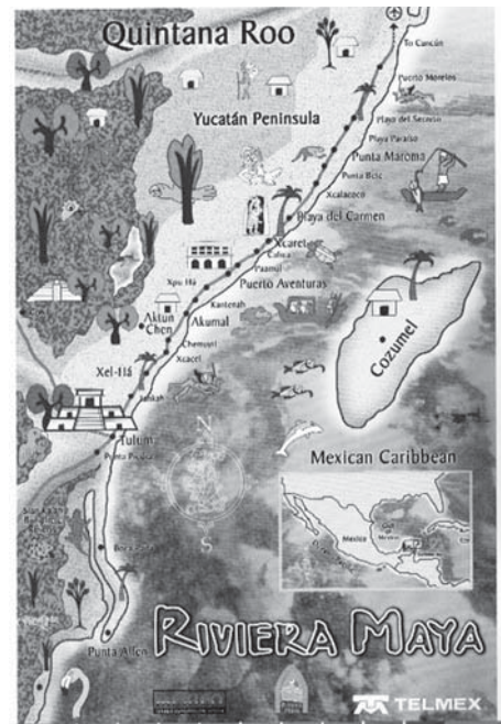
Fig. 2 Mapa de Riviera Maya, elaborado por el Fideicomiso de la Promoción Turística de Riviera Maya

El Mundo Maya ha impuesto unas imágenes nuevas que originalmente no tenía esta región, por varios medios como los libros de guía turística, la publicidad de las agencias de viaje, internet, la revista del mismo nombre