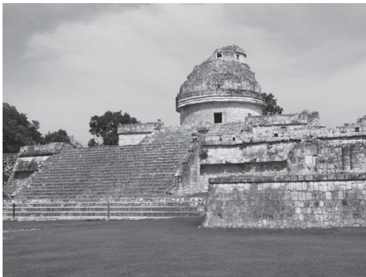
Foto 5 El Caracol del mismo sitio