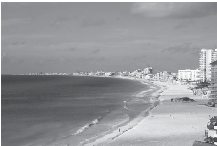
Foto 1 Cancún

Dentro de la corriente antes mencionada, Cancún surgió un gran desarrollo en la primera mitad de los 70(Foto 1). Pero fue en los años 80 que este lugar ganó la fama internacional