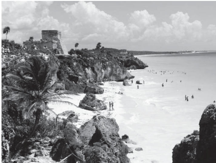
Foto 6 El Parque Arqueológico de Tulum

Mientras tanto, otros sitios “exitosos” se muestran a sí mismos de otra manera. En el caso del parque arqueológico de Tulum, las fotos de los edificios invariablemente aparecen en libros de guía, folletos de los tours, páginas Web, etc. Por eso casi todos los turistas tienen alguna imagen del sitio antes de visitarlo. Los edificios en las fotos siempre tienen el Mar Caribe de color azul claro en el fondo. Para este sitio es indispensable la imagen del precioso Mar Caribe. Aquí el color blanco de los edificios de piedra hace contraste con el azul claro del mar. Lo que fascina a los visitantes es este contraste. Y quiero añadir que aproximadamente la mitad de los visitantes de este sitio se bañan en la playa abajo de los edificios. Podemos decir que el parque arqueológico de Tulum tiene éxito por exponerse utilizando dos imágenes: la antigüedad y las playas (Foto 6).