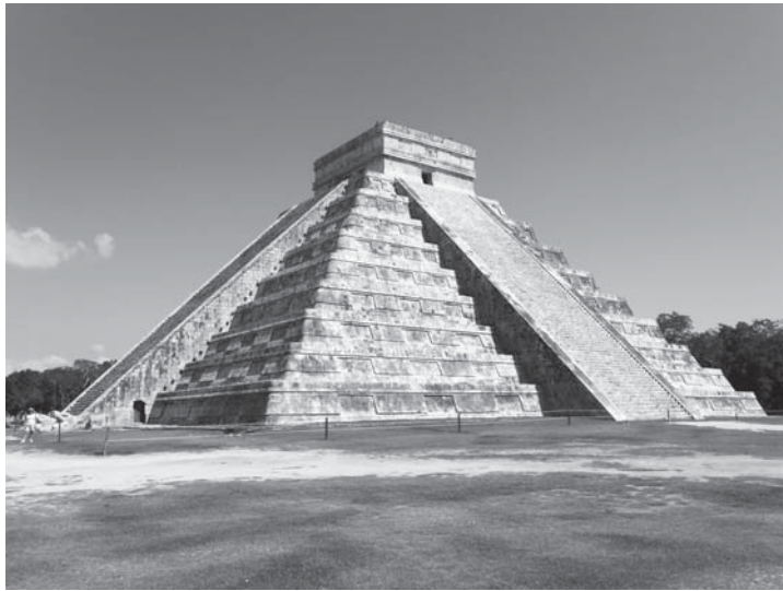
Foto 4 El Castillo del Parque Arqueológico de Chichen Itzá

En el caso de Chichén Itzá, por ejemplo, los elementos que esperan los turistas del sitio son los que se relacionan con la individualidad especial de este sitio, por ejemplo la grandeza y bella forma de cada edificio, los cuentos o historias que tocan unas partes del sitio, como el de la llegada de Kukulcán, los sacrificios en el Cenote Sagrado y en el Juego de Pelota, las ciencias de alto nivel que tenían los antiguos mayas, etc (Foto 4 y 5). Según