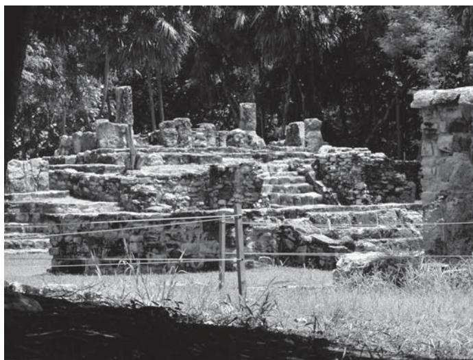
Foto 3 El Parque Arqueológico de El Meco

Por otro lado, en los sitios “exitosos”, populares como parques arqueológicos, tratan de mostrar una exhibición de acuerdo con las imágenes de los mayas que trae cada