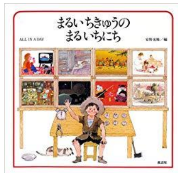
まるいちきゅうのまるいちにち 童話屋 作：安野光雅