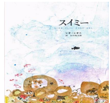
スイミー 好学社 作：レオ・レオニ