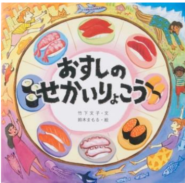
おすしのせかいいりこう 金の星社 文：竹下文子