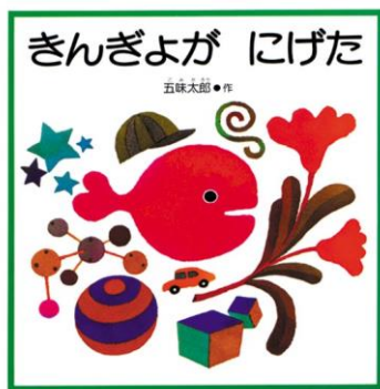
きんぎょがにげた 福音館 作：五味太郎