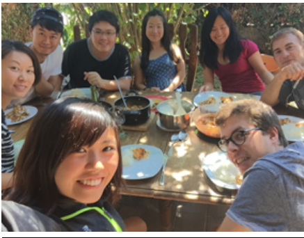
夏期講座参加者でのパーティ