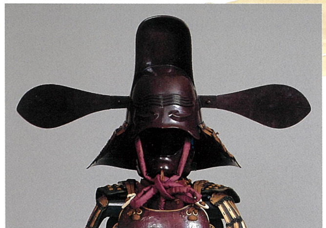
山口県指定文化財 唐冠形兜 山口・毛利博物館蔵 ※展示は兜のみ