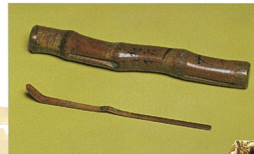
高山右近共筒茶杓 銘 御坊へ

明国征服後には天皇を北京へ移し、そこを新帝国の首都にするという秀吉の構想を伝える。