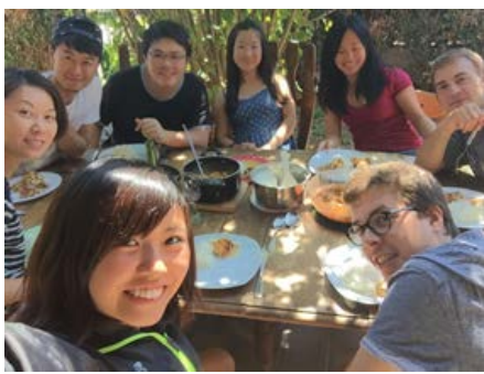
夏期講座参加者でのパーティ