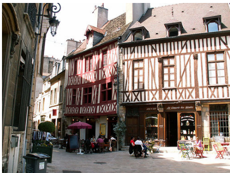
ディジョンの街並